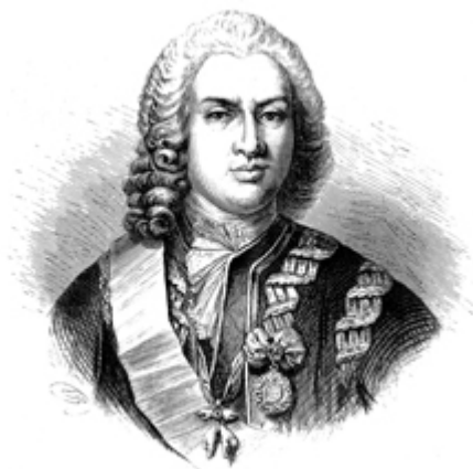
EL MARQUÉS DE LA ENSENADA.

Única Contribución de la Villa de Castriello Tejeriego Copia de las Respuestas Generales practicadas en esta Villa, a que han Satisfecho los Peritos nombados ael asunto son como se Siguen.