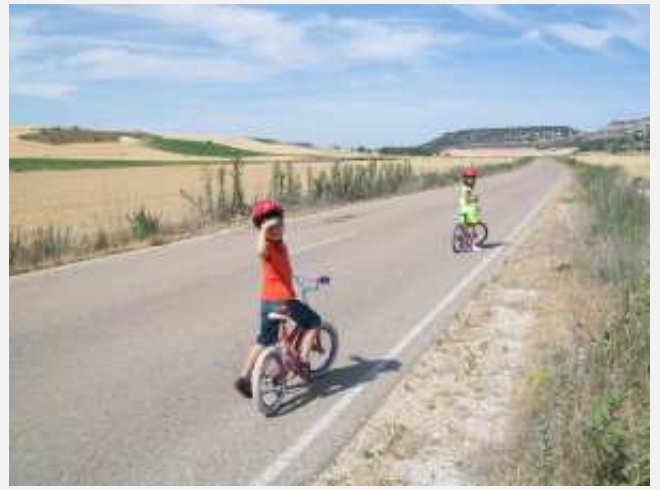
Carretera que va de Castrillo a La Sinova.

La verdad es que mi tío Alfredo se conoce bien La Sinova (antiguamente se escribía con “b”, ahora con “v”). Está muy cerca de su pueblo. El 6 de septiembre se acercaron a esta finca por aquello de las Rutas de Delibes. Salieron pronto, llegaron pronto. No eran dadas las 9. El sol en septiembre todavía caliente con ganas a mediodía y no era cuestión de volver sudando al pueblo. Mi tío me cuenta que en la información de las rutas cada pueblo tiene un ave y una planta relacionados con Delibes y con ese pueblo. El ave que corresponde a La Sinova es la perdiz. ¡Qué menos! Y la escoba como planta. La escoba, esa planta tan frecuente en toda Castilla y León, que nace en las cunetas, en los perdidos, en el páramo, es planta dura y aguerrida al terreno. En Castrillo Tejeriego (pueblo situado a 2 kilómetros de La Sinova) le han dado durante siglos el uso que merece por su nombre y ha barrido eras, corrales y portales de las casas hasta hoy. La escoba moderna, la que se compra en la tienda del pueblo, la de plástico, no ha logrado desbancarla del todo.